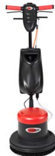
LS 160 HD