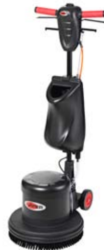
LS 160 low Speed